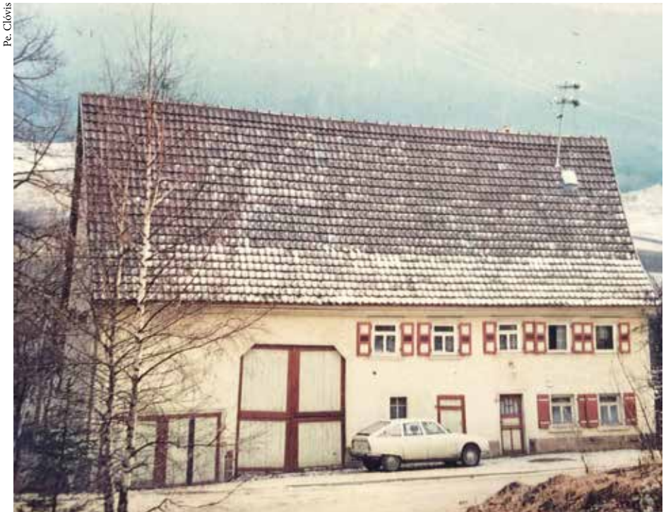
A casa onde nasceu o “pai dos pobres e enfermos” ainda existe

O que vai ser deste menino? Os acontecimentos em torno deste “homem de Deus” estão respondendo.